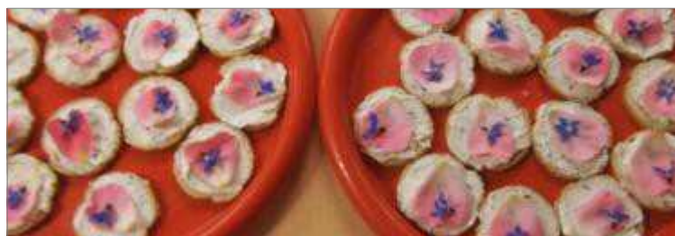
Toasts aux pétales de rose et fleurs de bourrache