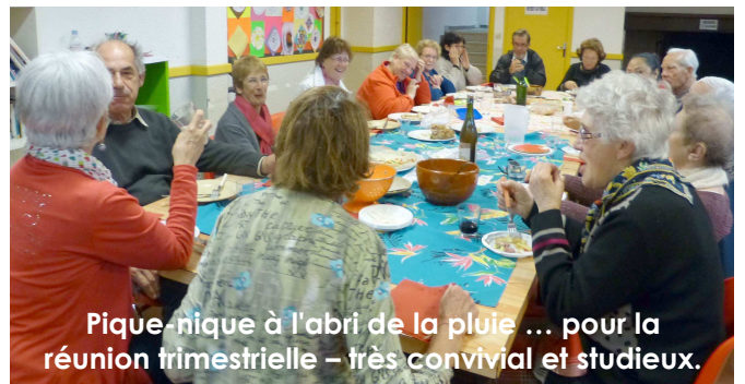
Pique-nique à l'abri de la pluie ... pour la réunion trimestrielle – très convivial et studieux.