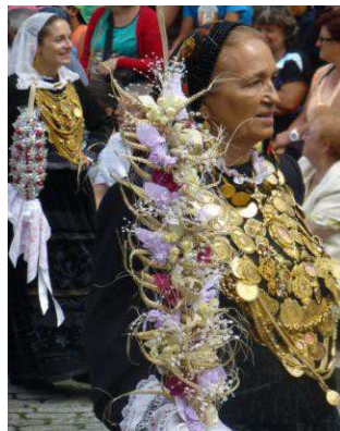
Femmes défilant en costumes traditionnels ornés de bijoux en or