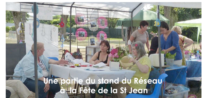
Une partie du stand du Réseau à la Fête de la St Jean