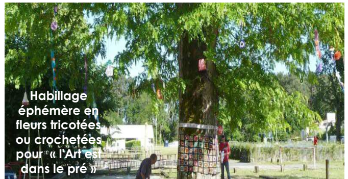
Habillage éphémère en fleurs tricotées ou crochétées pour « L'Art est dans le pré »

Bonnes vacances à tous et à bientôt ! Le groupe d'animateurs du RERS