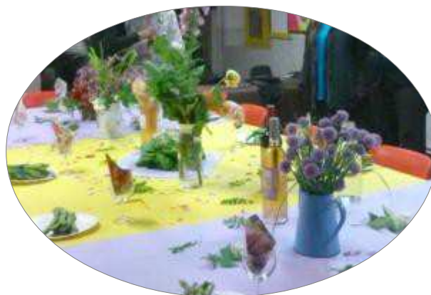
Table fleurie pour Menu de fleurs comestibles