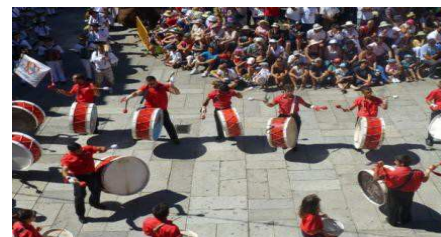
Bamberos frappant leur tambours