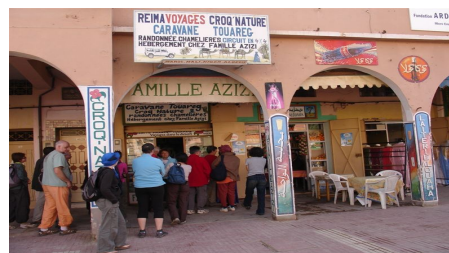
Reima Voyages", partenaire de Croq' Nature

Et il existe une Association pour le Tourisme Equitable et Solidaire : ATES , www.tourismesolidaire.org . ATES regroupe à ce jour une vingtaine de voyageurs et "associations relais" dont : Croq'nature – Amitié Franco.Touareg www.croqnature.com